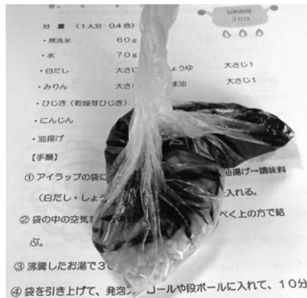
簡単な炊き出しごはん

定期に防災訓練を実施しているということだが、日々自宅にいる高齢者や障害者等に行き届いているか、心配なところだ。近年の災害は、忘れないうちに襲ってくる。最近ではモバイルバッテリーの発火による火災というのが社会問題