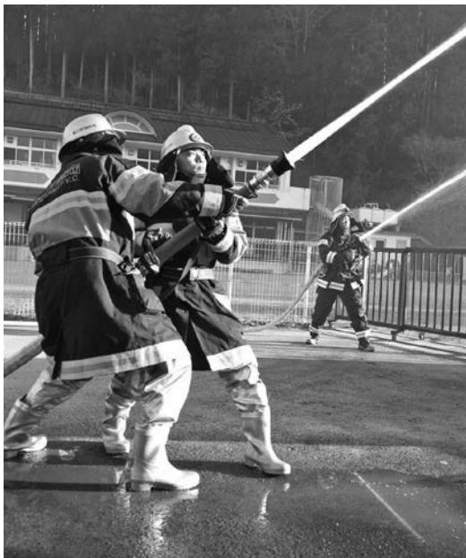
社会情勢の変化で消防団の在り方が問われている