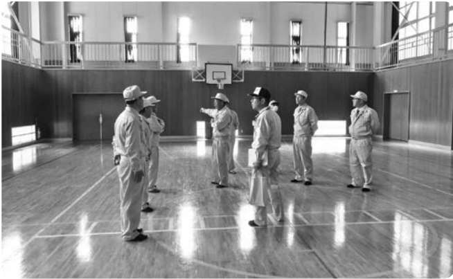
人工芝整備工事が進められる旧富田小体育館