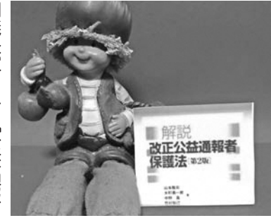
閣議決定された公益通報者保護法の改正案

問 ドライブレコーダーの設置と無事故対策は 答 安全運転への意識高揚と無事故対策を講じる