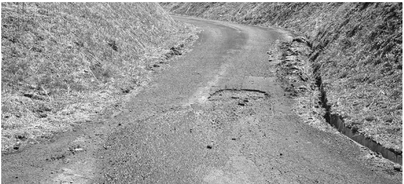
損傷が見られる進入路(西野グラウンド)