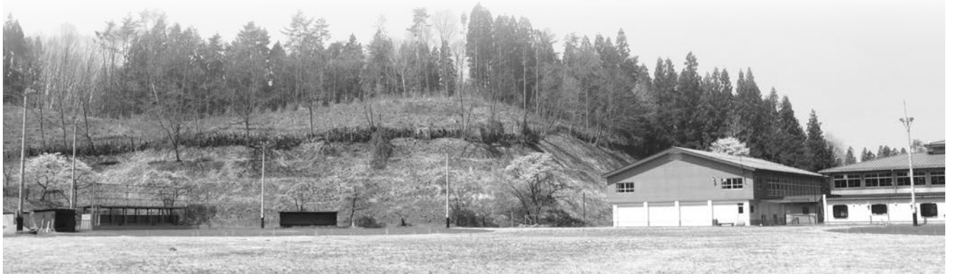
義務教育学校建設予定地の旧鮫川校跡地