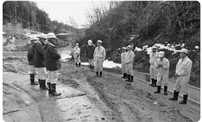
農業用水路修復工事中の水口地区