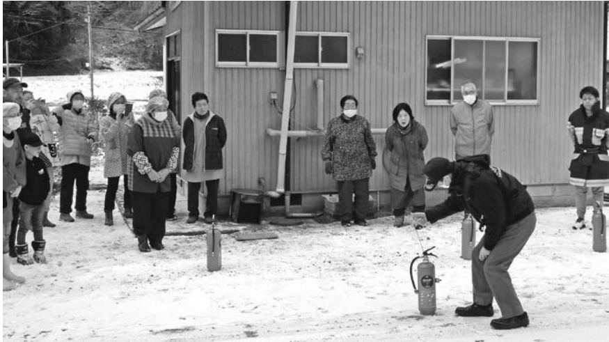
防災意識を高める落合地区での防災訓練