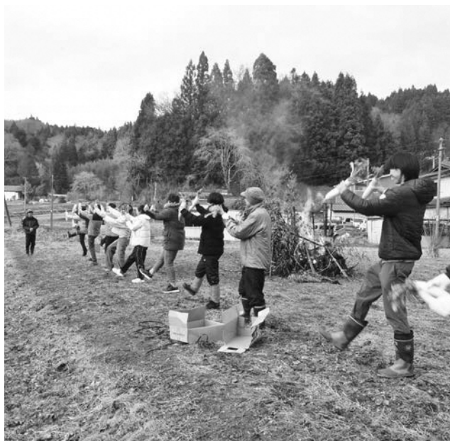
地域の行事に参加し、関係人口として貢献する東京農大生

関係人口とは、移住した定住人口でもなく観光などで一時的に訪れる交流人口でもない、地域と多様に関わる人々のことを指す、と言われている。人口減少が進む中で、地域の活性化を図っていくためには課題がある。この人口減少対策のキーワードは、関係人口の創出であり、これが将来的な地域の活性化に繋がると捉えられている。村では、関係人口創出のた