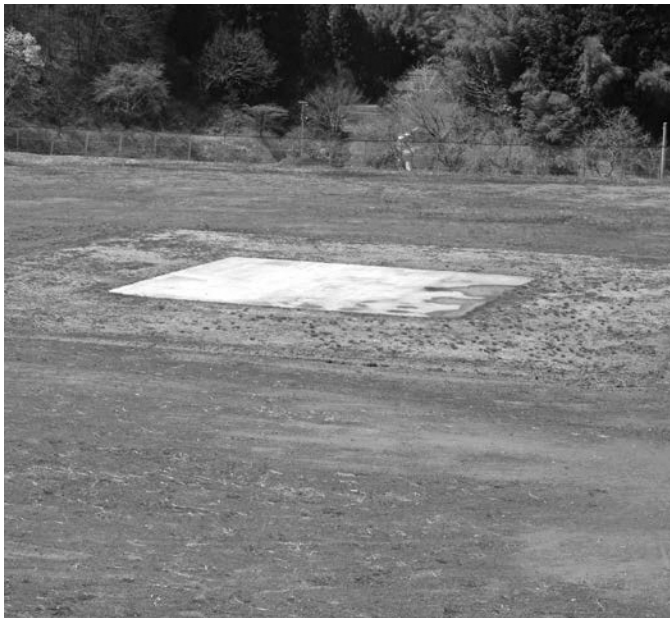
防災ヘリ、ドクターヘリ離着陸場の西野グラウンド

義務教育学校の開校が進んでいき、鮫川小学校が使えるようになれば、この校庭に新たに設置するというのが考えられるのではないかと。鮫川分署とも話したことがあり、一番ベストなのは鮫川小学校校庭などが良いのではないかとという話も聞いています。今後のことも含め、場所の選定を検討していく。