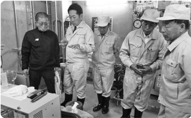
老朽化により更新される給水ポンプ(さざり荘機械室)