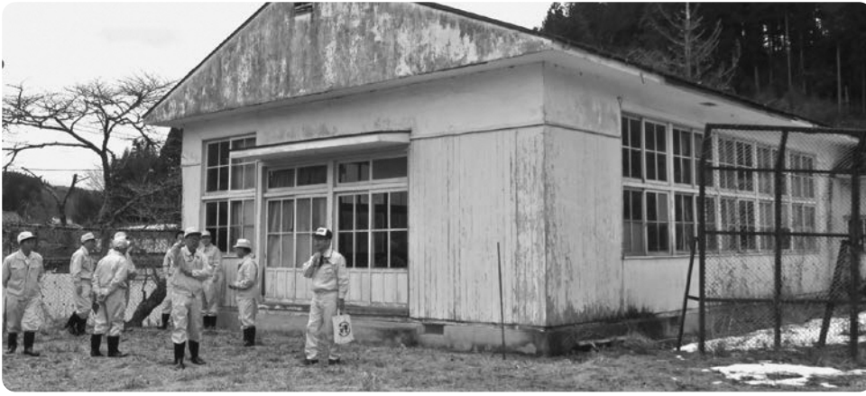
今後解体工事が予定される旧富田小講堂