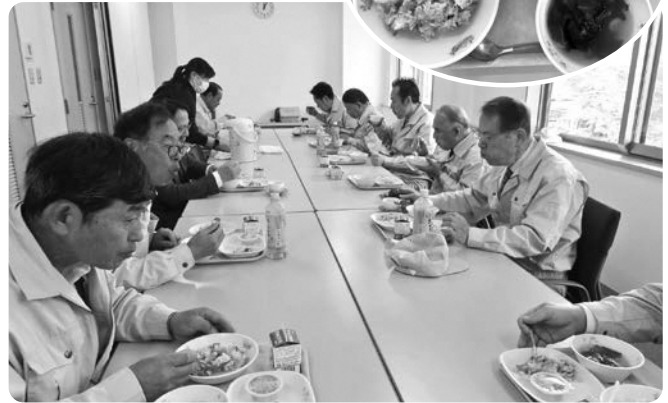
地場産品を活用した学校給食試食